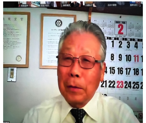
↑いつも素敵な河崎会員