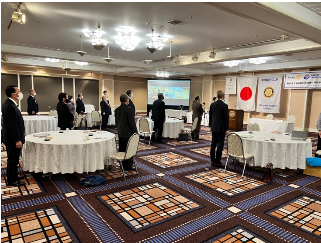
仲の良い会長&幹事⇒