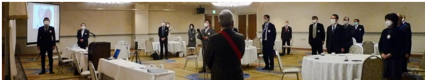
四つのテスト唱和