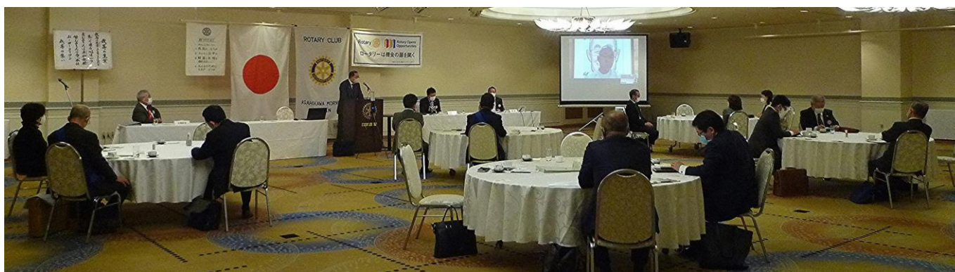
プログラム コロナウイルスとロータリー活動についての例会トーク