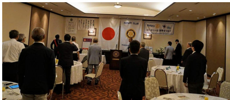
ロータリーソング 奉仕の理想