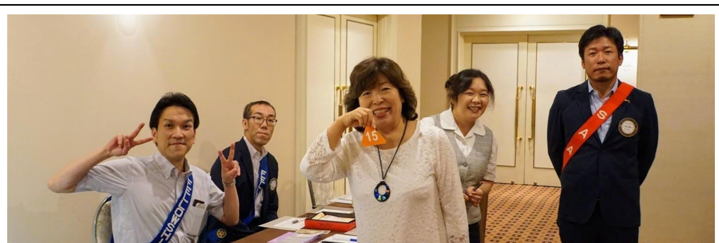
モーニングロータリークラブ 朝のさわやかな受付風景