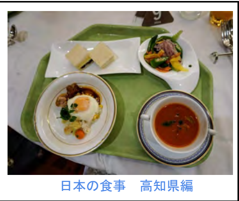
日本の食事 高知県編