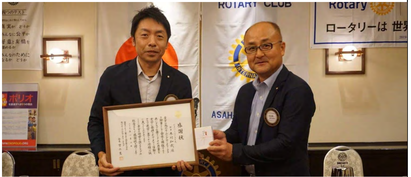
前年度幹事へ感謝状授与