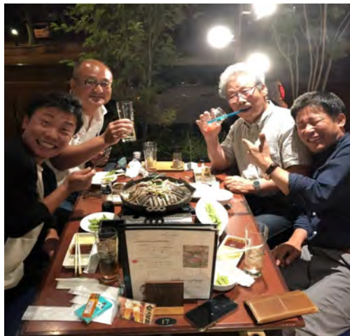
ゴルフ愛好会 懇親会 アートホテル