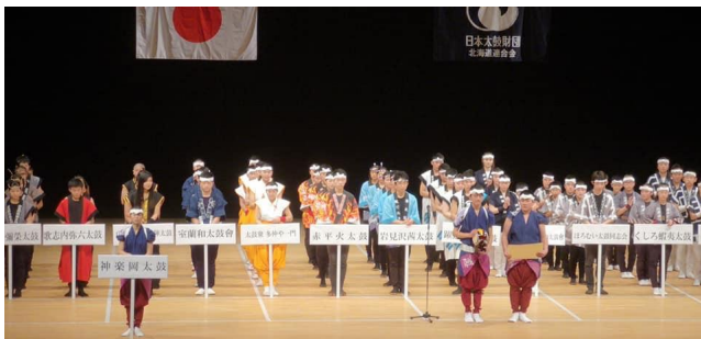
第2回北海道太鼓ジュニアコンクールで 2年連続 特別賞を受賞致しました。