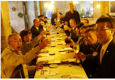
紅葉例会 開始 乾杯！