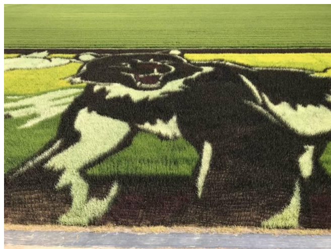
宮永会員のタイムラインの激写！

北海道命名150年を記念して、今年には北海道特有の動物たちを6種類の稲で描いています。