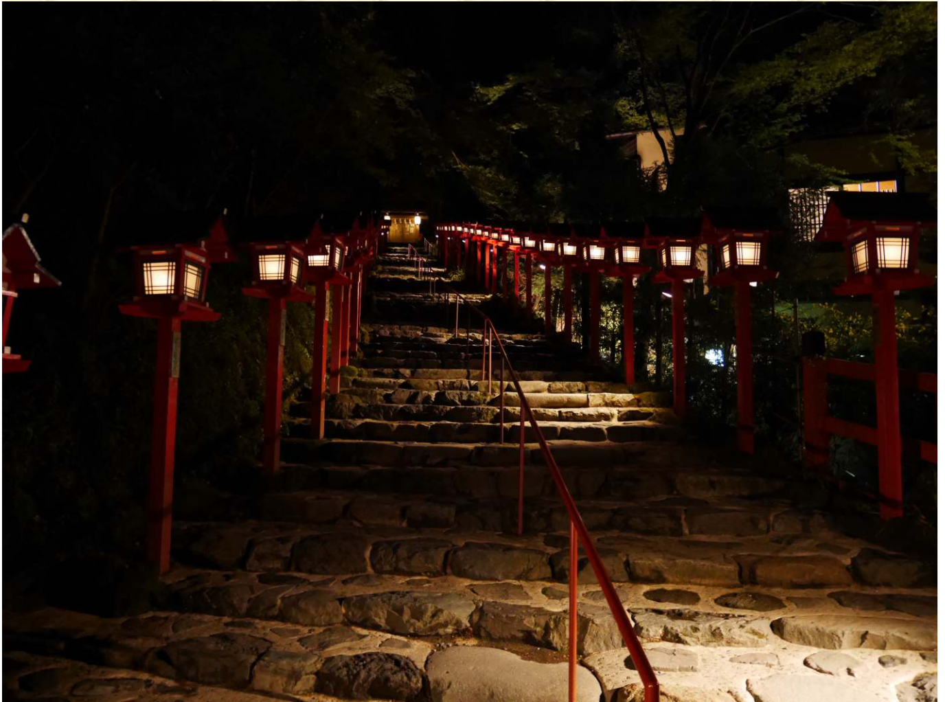
三日目 貴船神社燈明