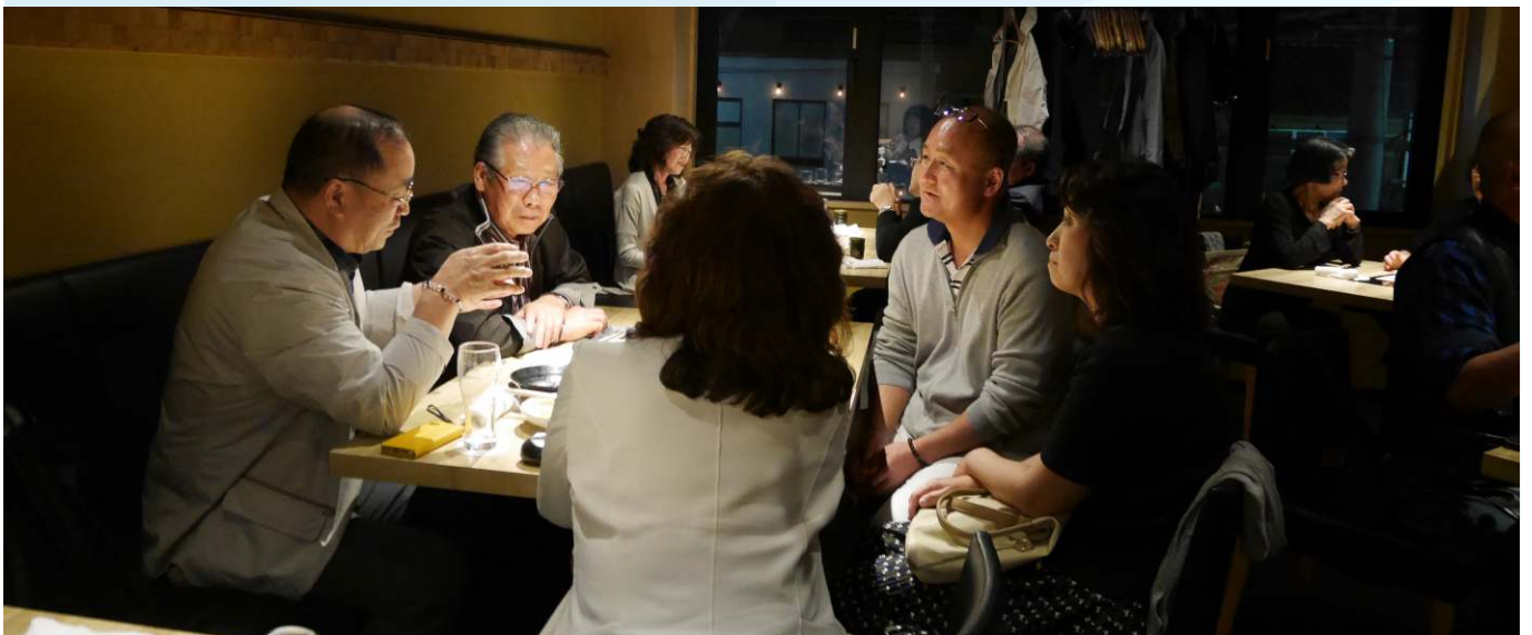
京都初日夜(まんざら亭)