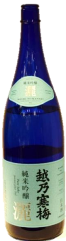
45年振りの新種 越乃寒梅 竹村親睦委員長ニコニコ