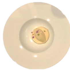
焙じ茶香るブランマンジェと アイスクリーム 山葵と塩のアクセント