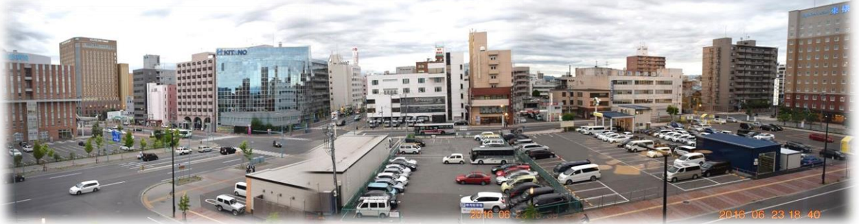
本日のマルウンホール 4Fからの旭川市内