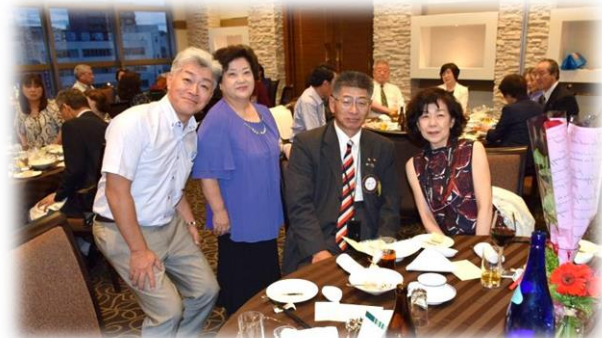
左から小川・福居会員・高見会長・林会員