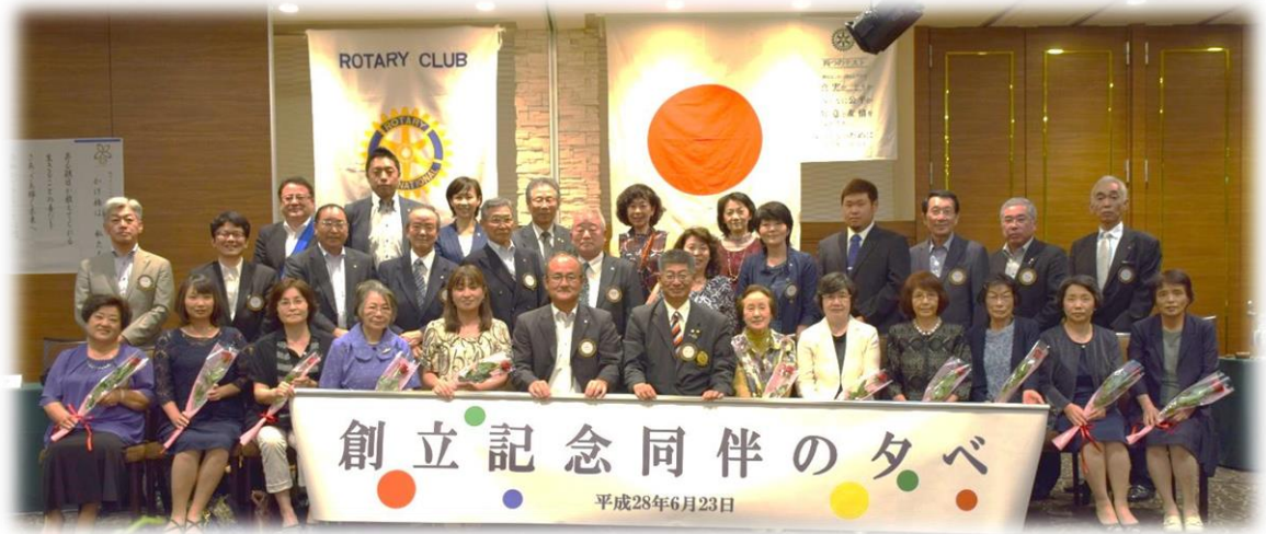
創立23周年記念 同伴の夕べ 記念写真