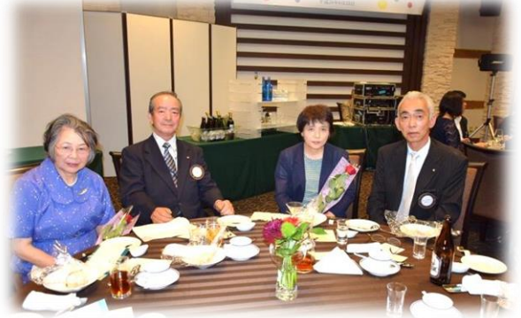
左から竹澤夫人・竹澤会員・佐々木夫人・佐々木会員