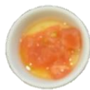
冷やしトマトの ロイヤル