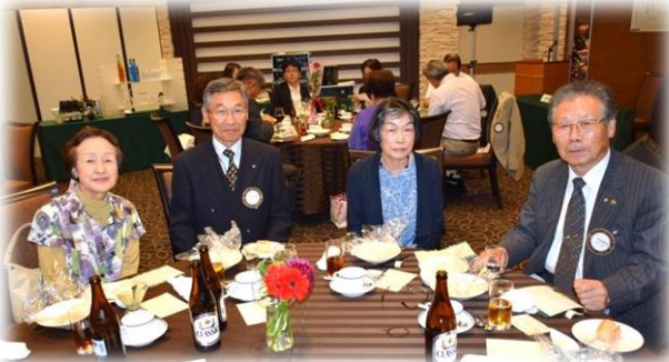
左から笹川夫人・笹川会員・河崎夫人・河崎会員