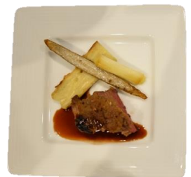
牛ロースのシャリアピン風 牛蒡のプレゼと焼き葱赤ワインソース