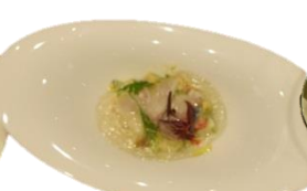
縞鯡のマリネ夏野菜のタルタル 白バルサミコのジュレ