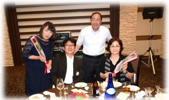
左から井上夫人・井上・石川会員・石川夫人