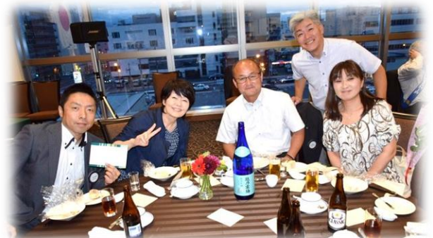
左から木村・小柳会員・宮永幹事・小川会員・宮永夫人