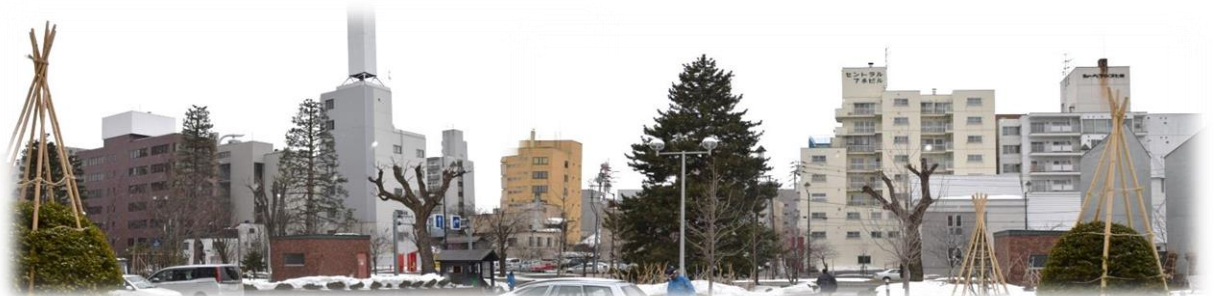
旭川市議会会場玄関からの旭川市内