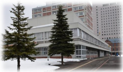
旭川市議会議場 (第3委員会室)