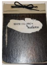
旭川モーニングRC 例会出席簿