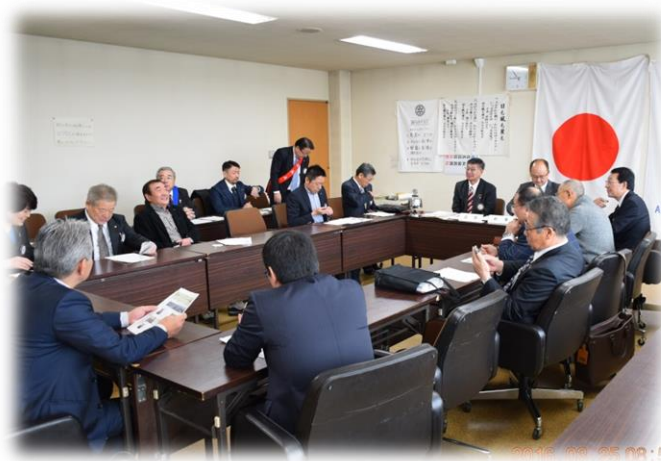
第3委員会室にての例会・懇談