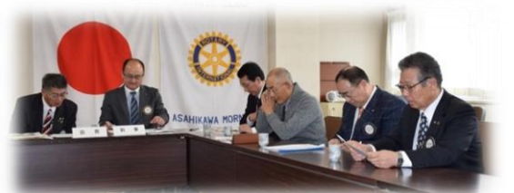
第3委員会室にての例会・懇談