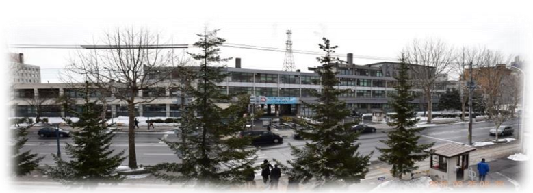
今朝の旭川市議会議場 2階からの旭川市内