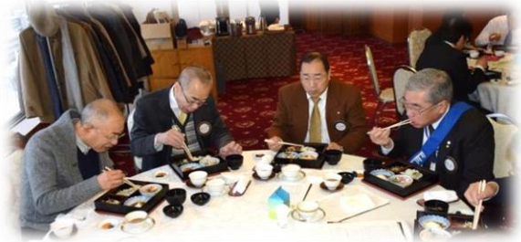
15階 シャルムにての朝食と懇談