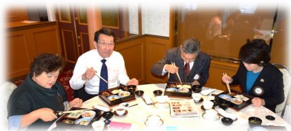
15階 シャルムにての朝食と懇談