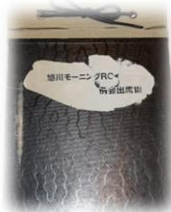
旭川モーニングRC 例会出席簿