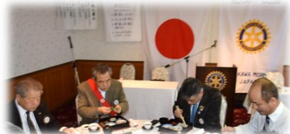
15階 シャルムにての朝食と懇談