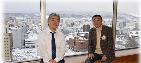
食後の至福 smoke time