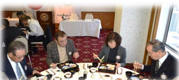
15階 シャルムにての朝食と懇談