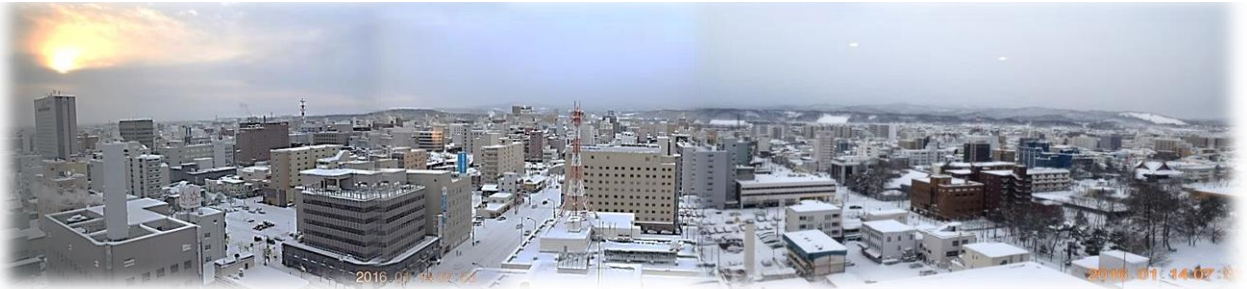
今朝の 15 F シャルムからの旭川市内