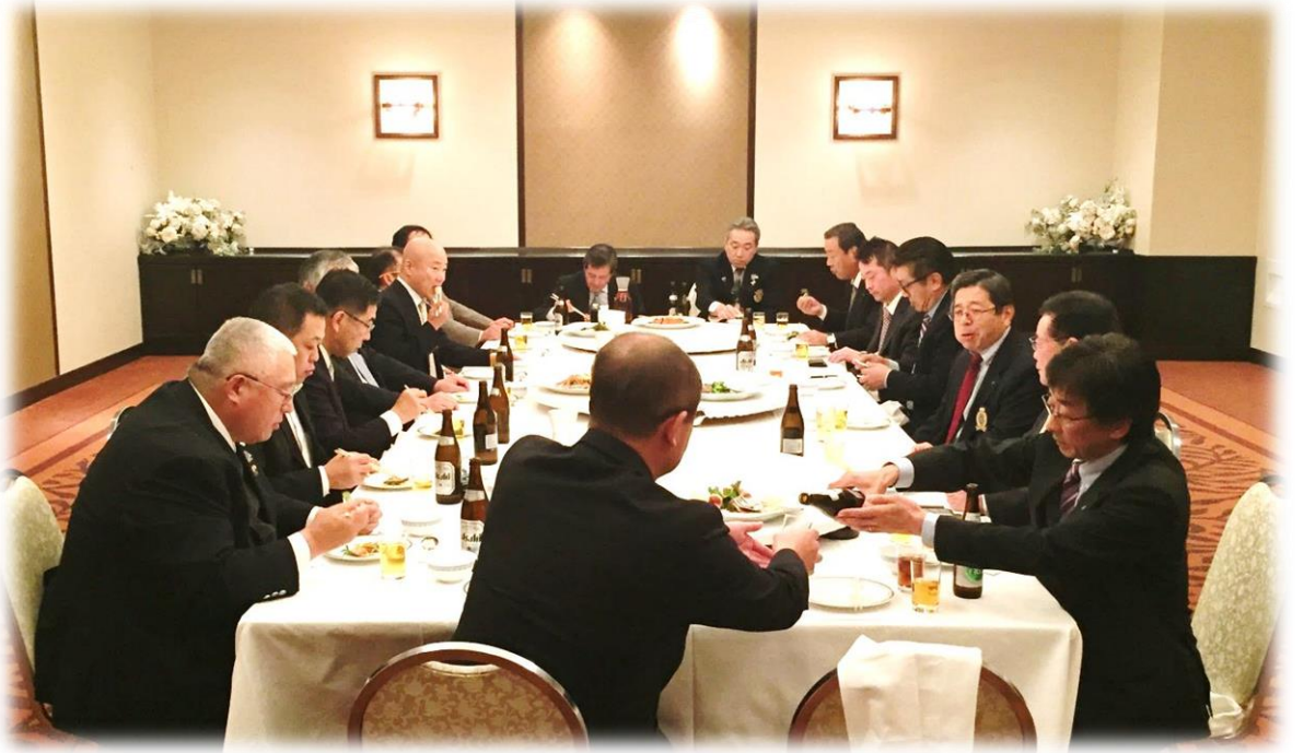
平成27年11月27日（金）第2500地区第3分区 会長幹事会 ホスト役 旭川モーニングロータリークラブ