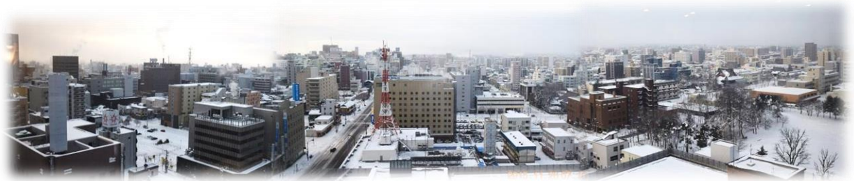
今朝の15Fシャルムからの旭川市内