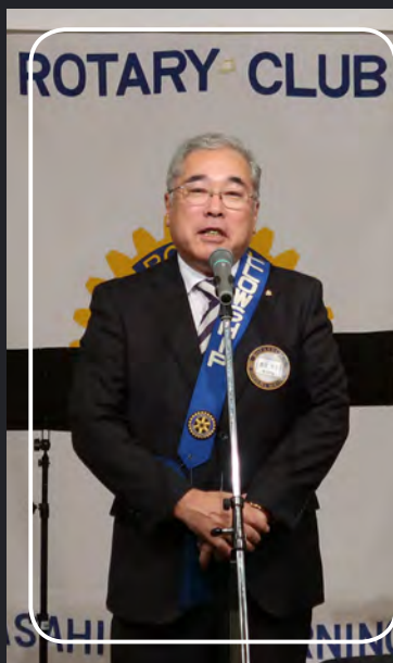
開会挨拶 飯塚会員