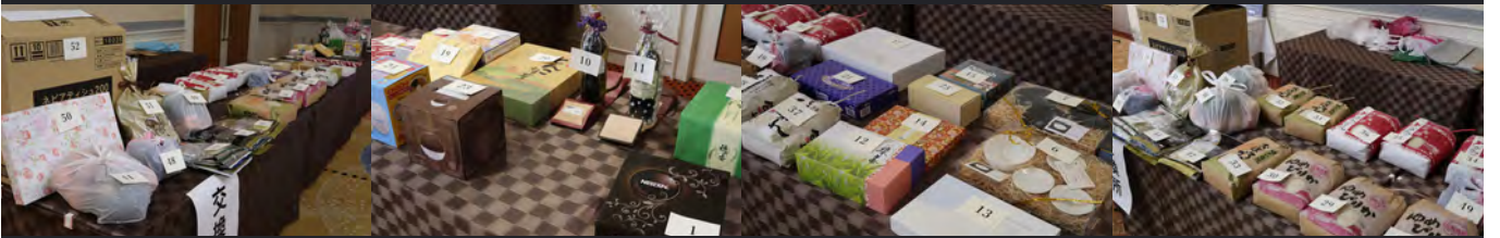
出品を待つ品物たち