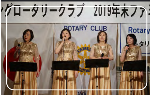
余興～ Fantastics の皆さん