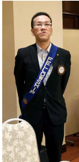
小林:四つのテスト