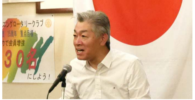
小川:愛ロータリー