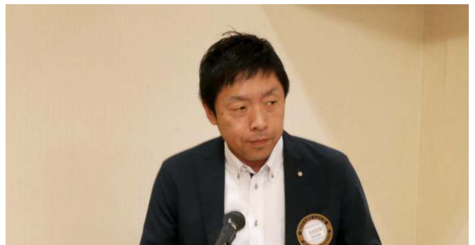
木村:次年度各委員会活動計画発表進行