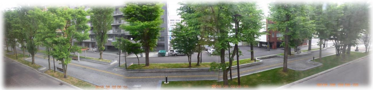
今朝の旭川市内・7条緑道