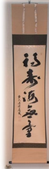
”福寿海無量” 積應和尚筆