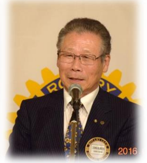
河崎会員による関東一本締め