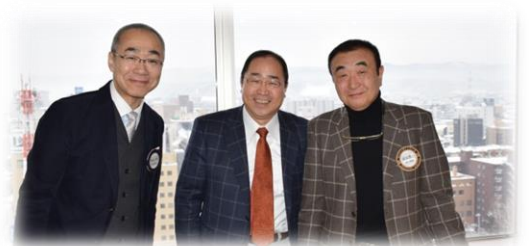
食後の至福 talk time