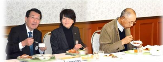
15階 シャルムにての朝食と懇談