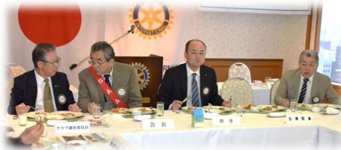
15階 シャルムにての朝食と懇談