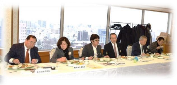
15階 シャルムにての朝食と懇談