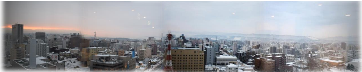
今朝の15Fシャルムからの旭川市内