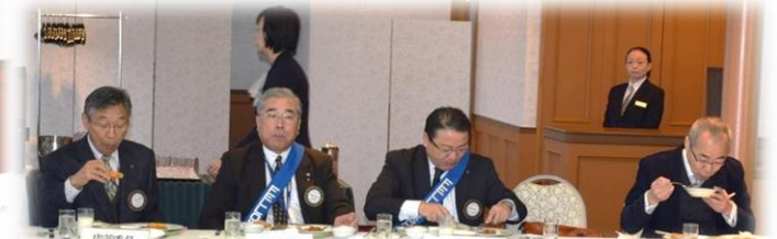
15階 シャルムにての朝食と懇談