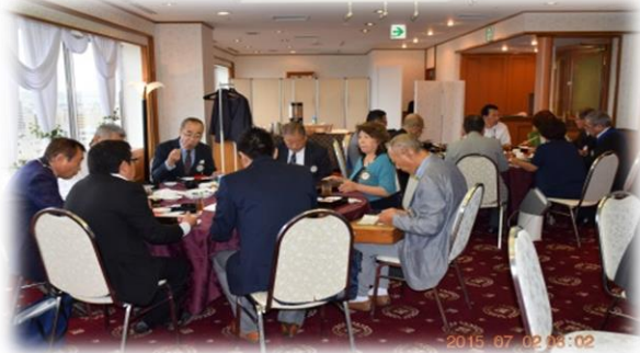
数か月振りに2 階コスモスから1 5 階シャルムにての懇談