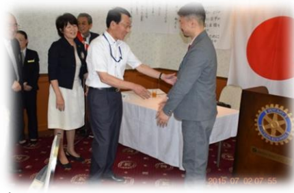
会員全員の握手にての歓迎入会セレモニー