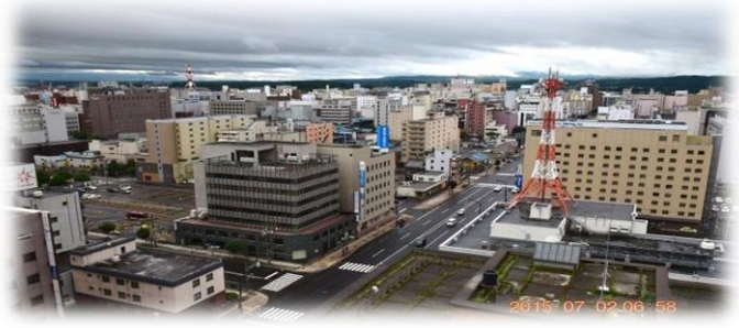
今朝の旭川の風景(ロワジールホテル・シャルム15階より)