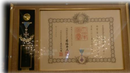
瑞宝単光章 表彰状