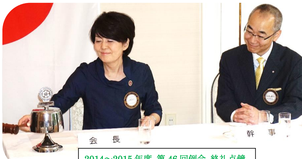
2014～2015年度 第46回例会 終礼点鐘